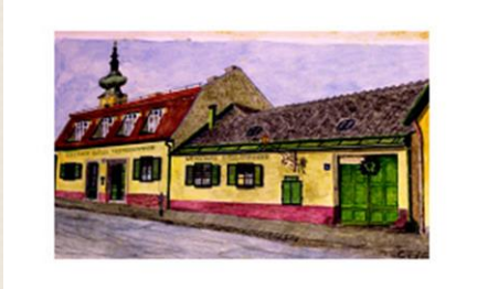
HEURIGER SCHNEIDER GÖSSL

Familie Schneider führt in Wien ein Heuriger Lokal mit traumhaftem Gastgarten in direkter Nähe vom Schloss Schönbrunn. Auch für erholsame Übernachtungen ist gesorgt: gemütliche Hotelzimmer im Wiener Stil, große, komfortable Apartments und neue Suiten.